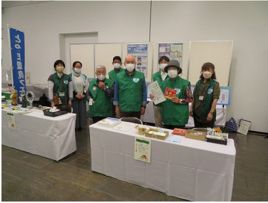
とやま環境フェア