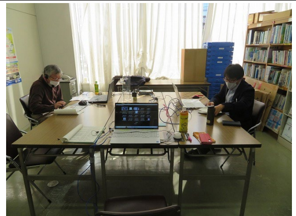
中部ブロック研修会 (富山県発表者)